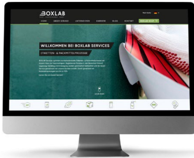
Abbildung 1 Startseite