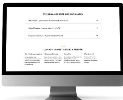
Abbildung 4 Karrierebereich