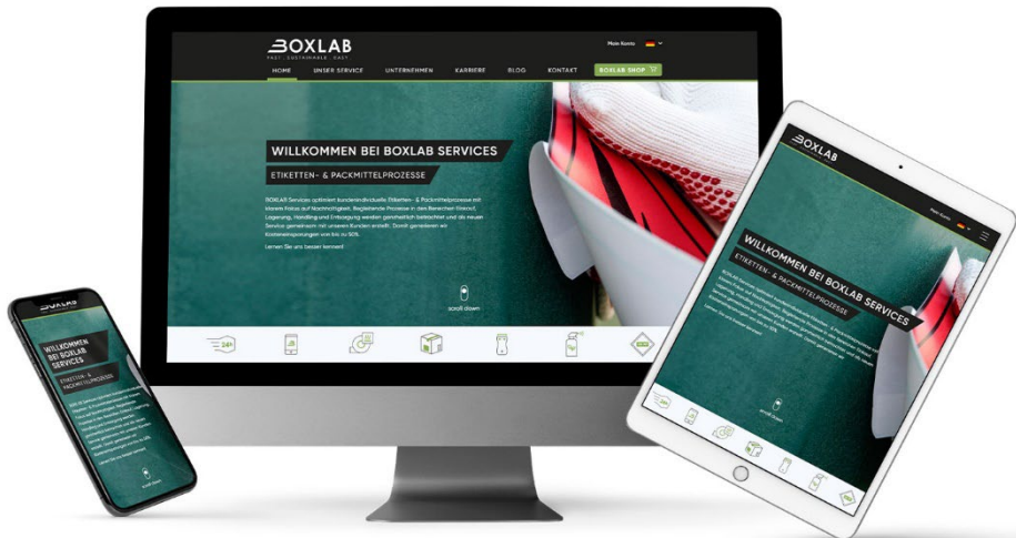
Abbildung 5 Responsive Design